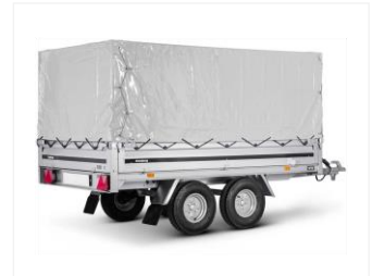
HOCHPLANE MIT GESTELL 310440

1500x2580x820mm grau Gestell aus Vierkantröhr