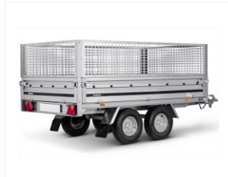
LAUBGITTERAUFSATZ 50 CM 311540

Stahl, 1420x2500x500mm, mit losen Beinen