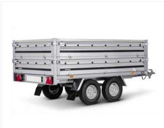
KASTENAUFSATZ 35 CM 307368