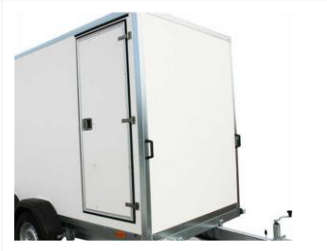
SEITENTÜR VERSCHLIEßBAR 304895M

600x1600 mm. Für Modell mit Seitenhöhe von 1850mm, ab Werk montiert