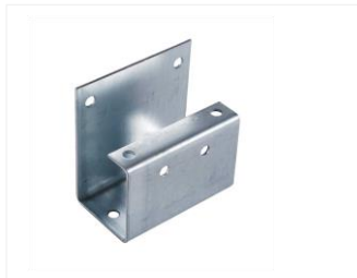
BESCHLAG FÜR STÜTZBEIN 113113