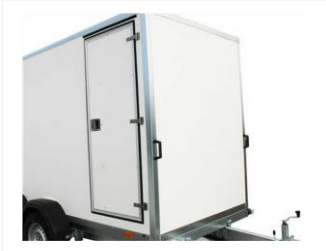
SEITENTÜR VERSCHLIEßBAR 304895M

600x1600 mm. Für Modell mit Seitenhöhe von 1850mm, ab Werk montiert