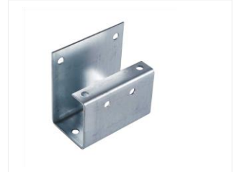
BESCHLAG FÜR STÜTZBEIN 113113