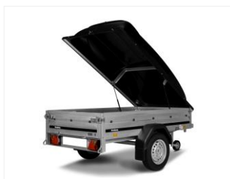
KUNSTSTOFFDECKEL 308110 1160x2030x450 mm mit Montagesatz