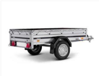
ABDECKNETZ 104014 Schwarz, 1240x2120 mm