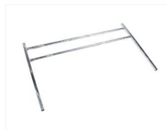
LADEGITTER 113769 Feuerverzinkt, B=1220 mm H=500 mm