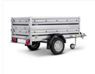
KASTENAUFSATZ 307360 Stahl, 1160x2030x350 mm