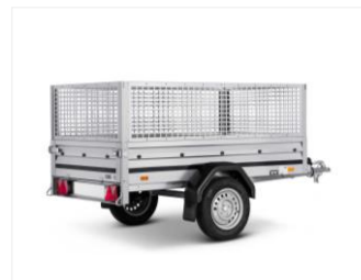
LAUBGITTERSATZ 50 CM 311519 1160x2040x500 mm lose Beine