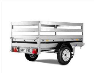
RELINGS-KIT 102865 Stahl, 1160x2040x400 mm