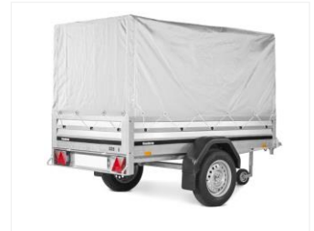
HOCHPLANE MIT GESTELL 310442 Grau, 1230x2120x810mm