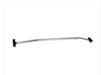
PLANENBÜGEL 313032 verstellbar, 1000–1450 mm

*im Lieferumfang nicht enthalten. Separat erhältlich.