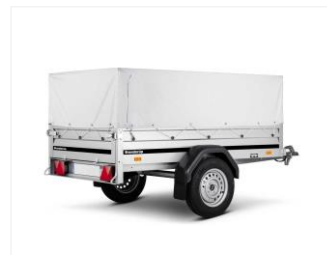
ÜBERZUGSPANE 302615 Grau, 1230x2120x575 mm Für Laubgitter 311519