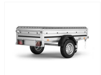
RELINGS-KIT 166930 2-seitig, Stahl, auf Längsseiten montiert, L=2040