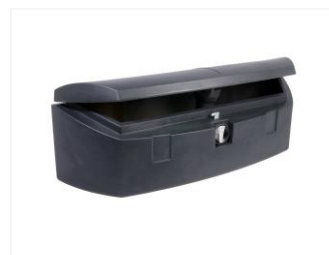
WERKZEUGKISTE SCHWARZ 115873 Kunststoff, inkl. Montagesatz, 300x1080x330 mm