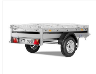
FLACHPLANE 302610 Grau, 1160x2040 mm