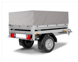
ÜBERZUGSPLANE 45 CM 302624

Für Reling-Kit (102866) B1010 x L1520 x H450 mm Innenmaße 1440x940 mm