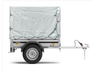
HOCHPLANE MIT GESTELL 310446